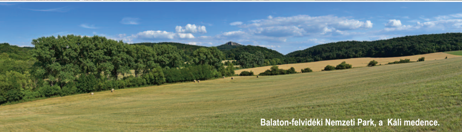
Balaton-felvidéki Nemzeti Park, a Káli medence.