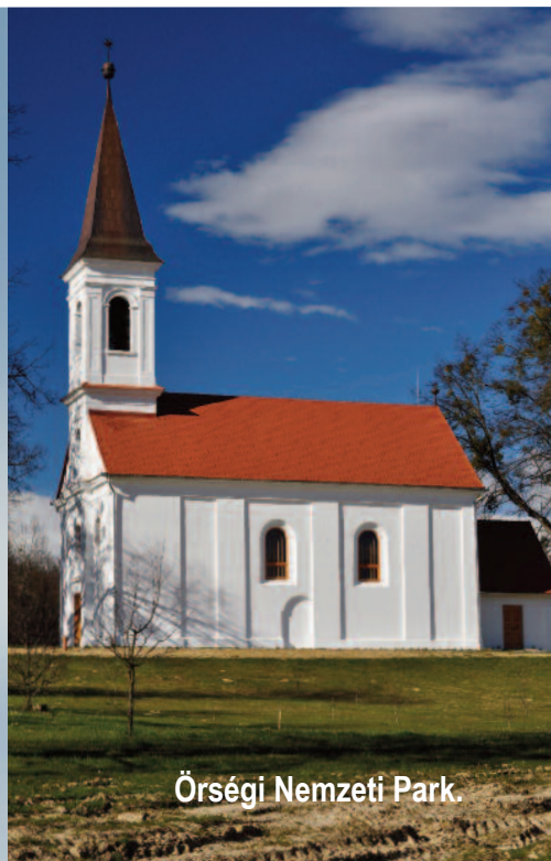
Örségi Nemzeti Park.