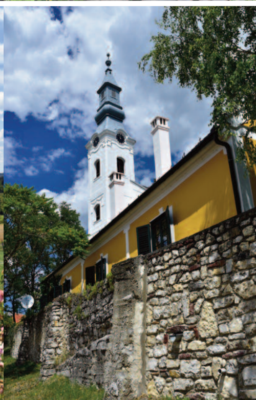
Balaton-felvidéki Nemzeti Park, a Káli medence.