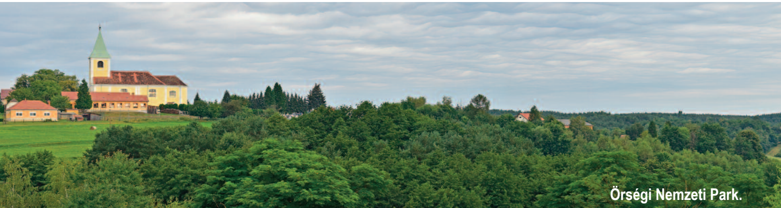
Örségi Nemzeti Park.