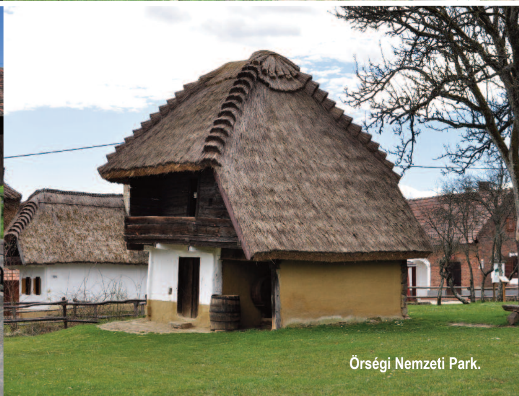
Örségi Nemzeti Park.